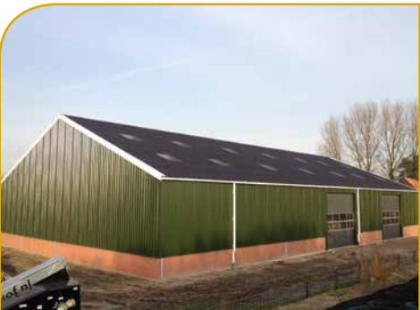
Maatschap Wit Driehuizen