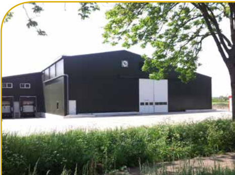
Maatschap Stam Schaap Ursem