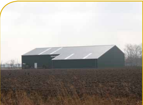
Kruijer Noord Scharwoude